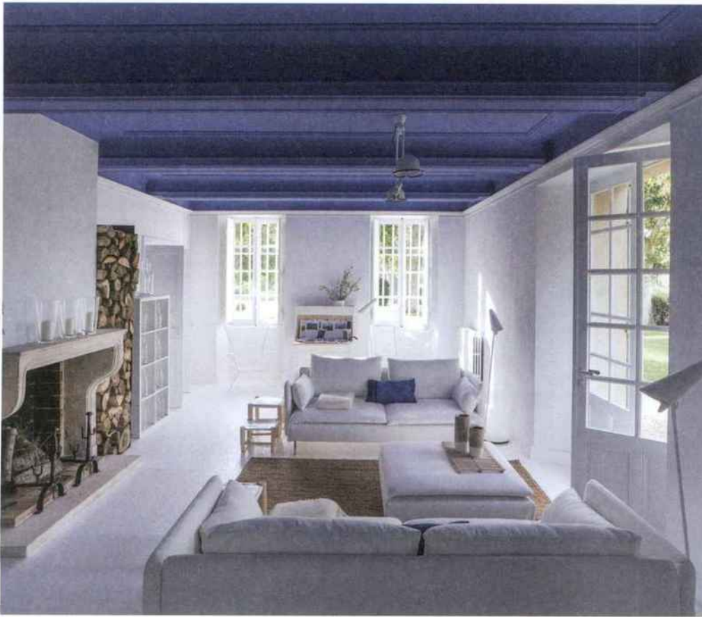
6 MANGANÈSE EDITIONS

6 Le blanc ne donne tout simplement pas de repère et renvoie à une certaine monotonie. L'associer à des surfaces colorées, un sol graphique ou un aplat de couleur au plafond permet de le contrebalancer. MANGANÈSE EDITIONS