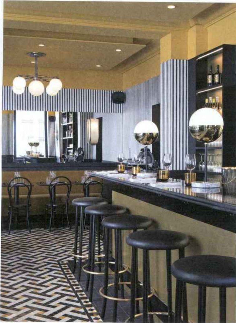
2 BE ATTITUDE

1 La couleur capture des fragments de paysages vus du ciel pour restituer une ambiance harmonieuse et sereine dans un espace de travail. Dans un environnement doté d'un éclairage naturel et agrémenté de verdure - les nuances vertes apaisent - les employés sont 15% plus créatifs et 6% plus productifs. Collection de sol textile Carpetecture®, Human Fascination, Flores. DESSO